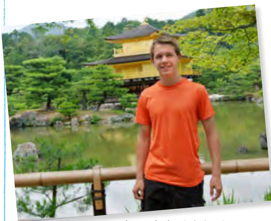
2013年6月、初来日したタッカー君。 京都の金閣寺にて

*注：神経可塑性とは、シナプスの信号伝達能力や形が、刺激の量によって変化・適応すること。