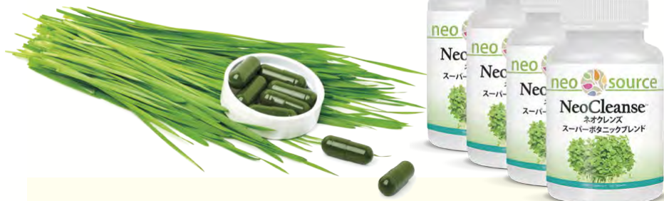
「ネオクレンズ」4本セット 10%OFFキャンペーン専用商品番号:4045P 価格:$180

「ネオクレンズ」は、90日間のデトックス・プロトコルです。 皆様がこのプロトコルをしっかりと完了できるよう、 お得な1本120カプセル入り×4本セットをご用意しました。